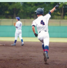
高3夏の大会でホームランを打ったのが良き思い出です。