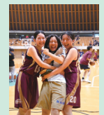
学生時代、バスケをとにかく頑張りました！