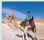
エジプト旅行でラクダに乗ってピラミッド周辺を散策。