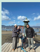
家族旅行で訪れた広島県宮島にある厳島神社へ。