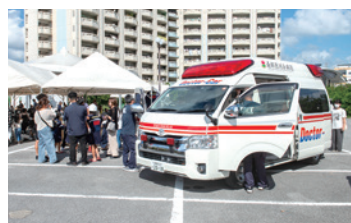
救急車やドクターカーも登場