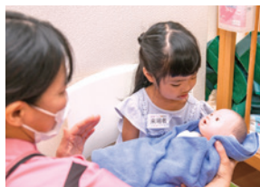
ふれあい看護体験で赤ちゃんを抱っこ