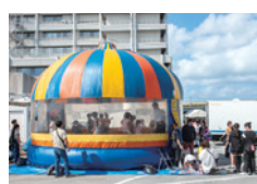
子どもたちで賑わうふわふわランド