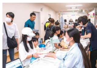
薬剤師と調剤体験コーナー