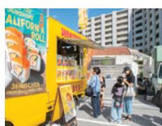
毎年人気のキッチンカー