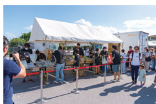
野菜売り場也大盛況！