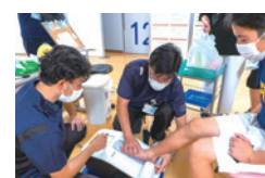
骨密度、どれくらい？