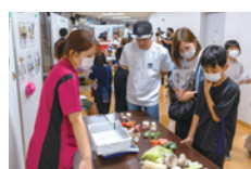
栄養バランスを考えよう