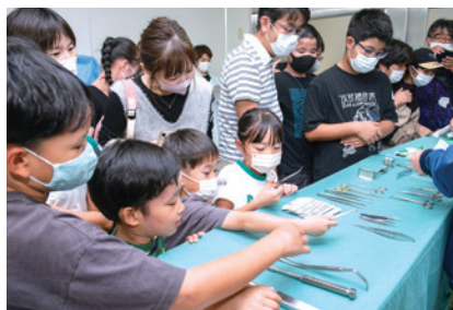
手術にはどんな器具が使われている？