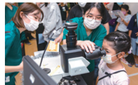
顕微鏡で細胞を観察