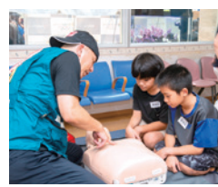
救命体験にもチャレンジ