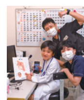
スタジオナントクでお医者さんに変身！