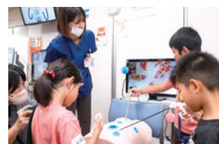
内視鏡カメラを覗いてみよう