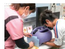
手の汚れ、見えるかな？