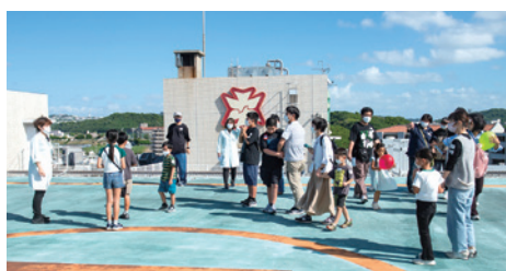
院内ツアーでは、屋上のヘリポートへ！