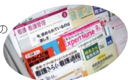
看護知識・技術の向上のため日々の学習はかせません

これは特定の看護師が、特定の患者さんのケアを固定的に行うんじゃないかと、チームで患者さんを見ていこうというもので、チームリーダーを中心に、看護師や看護助手が、