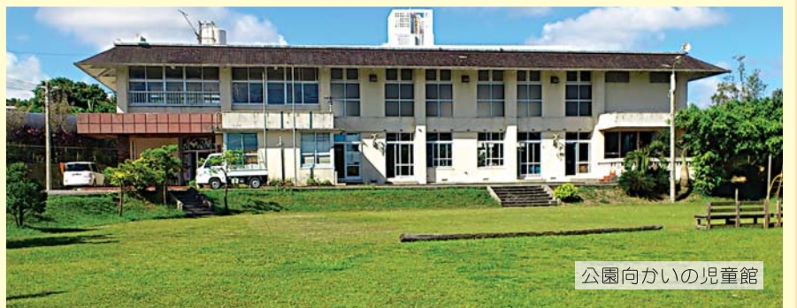
公園向かいの児童館

旧東風平町の友寄の獅子舞は、毎年、8月15日友寄公民館で行われます。その由来は、1821年に当時流行した天然痘除けとして始まったといわれています。この馬場公園の獅子舞遊具は、この獅子舞を伝承するシンボルとして平成7年に設置、獅子の前足の間の急な階段を上り、しっぽ目がけて滑り台を一気に滑り降りる、なかなかダイナミックな滑り台です。公園といっても、中にはこの滑り台と芝生の広場が広がるだけのシンプルなつくりで、のんびりするには最適かも。