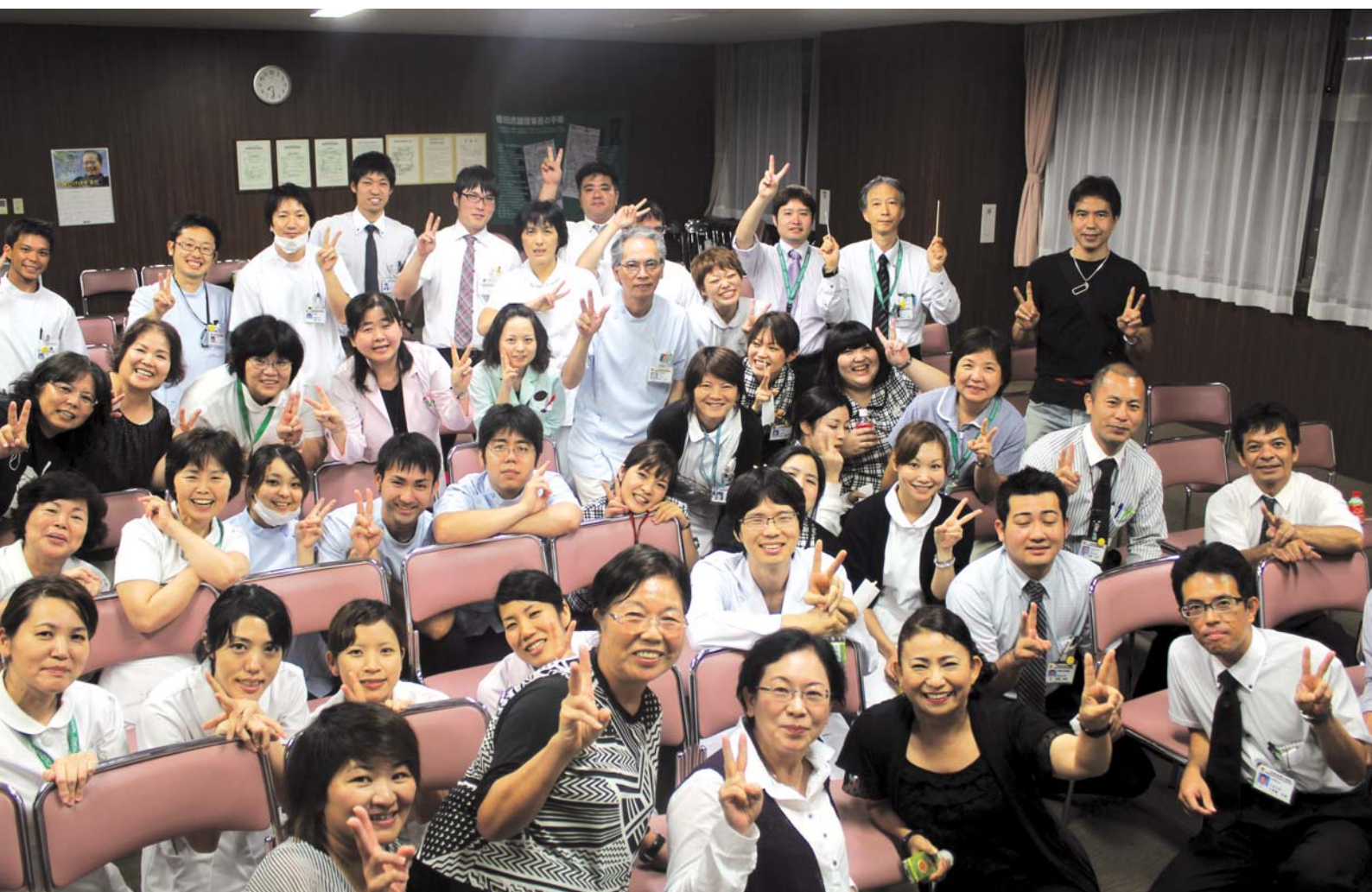
教育講演「笑って今を生きる」

NANBU TOKUSHUKAI HOSPITAL PUBLIC RELATIONS MAGAZINE 2012.7.10