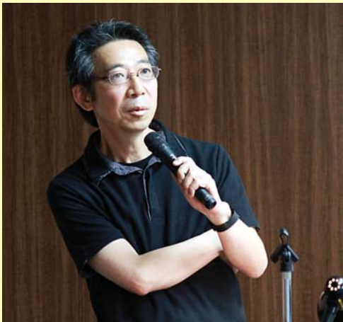
練馬光が丘病院 夏井睦先生

「これからの創傷治療」や「さらば消毒とガーゼ」、「うるおい治療」が傷を治す」などの著書で知られる夏井先生は、傷を消毒しない、そして乾燥させないで治療する湿潤治療を提唱し、全国で多くの支持を集めている。