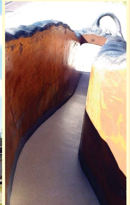
なかなか急な滑り台