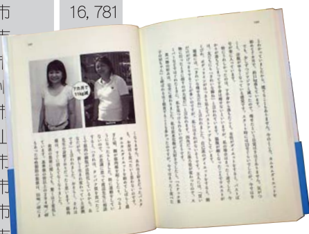
本書で紹介されている成功事例のひとつ

になる、と実感したことです。特に、いわゆるメタボリック・ドミノ(高血圧、肥満、高脂血症、高血糖の死の四重奏を引き起こしてしまうこと)を防ぐことこそが、患者さんを救う近道だと確信したことがきっかけですね。 「ありがとうございます。なんか、話が佳境に入りつつあるところで誠にもうしわけありませんが(笑)、詳しい内容については、次回ということをお願いしましょうね。」