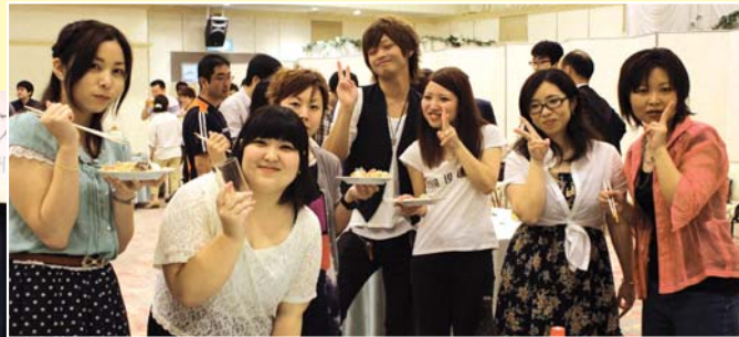
年度 新入職員三 法人 沖縄徳洲会 南部徳洲