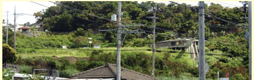
バス停からは西部プラザ公園が見える

幹回り約18メートル、約高さ12メートルで枝張りは東西約12メートル、南北約19メートルの巨大なガジュマル。樹齢は推定800年といわれています。