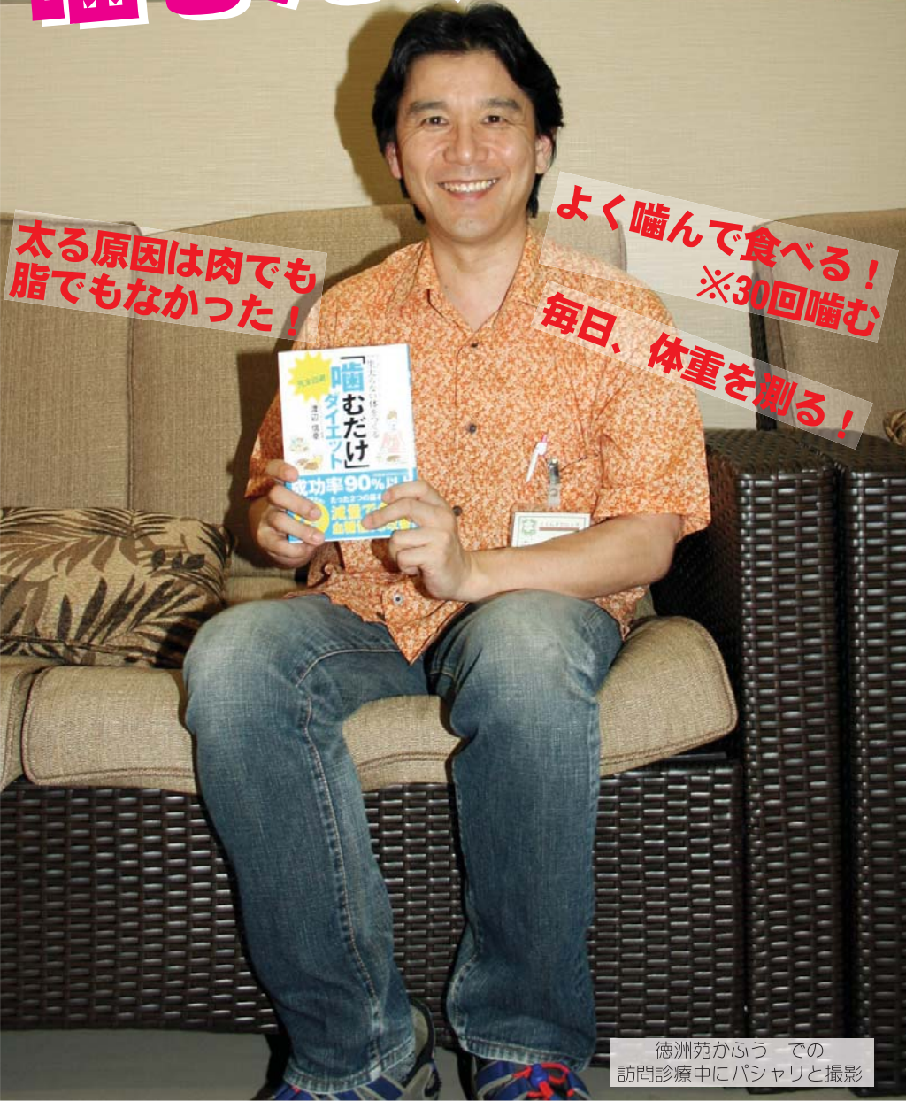
徳洲苑かふう での訪問診療中にパシャリと撮影