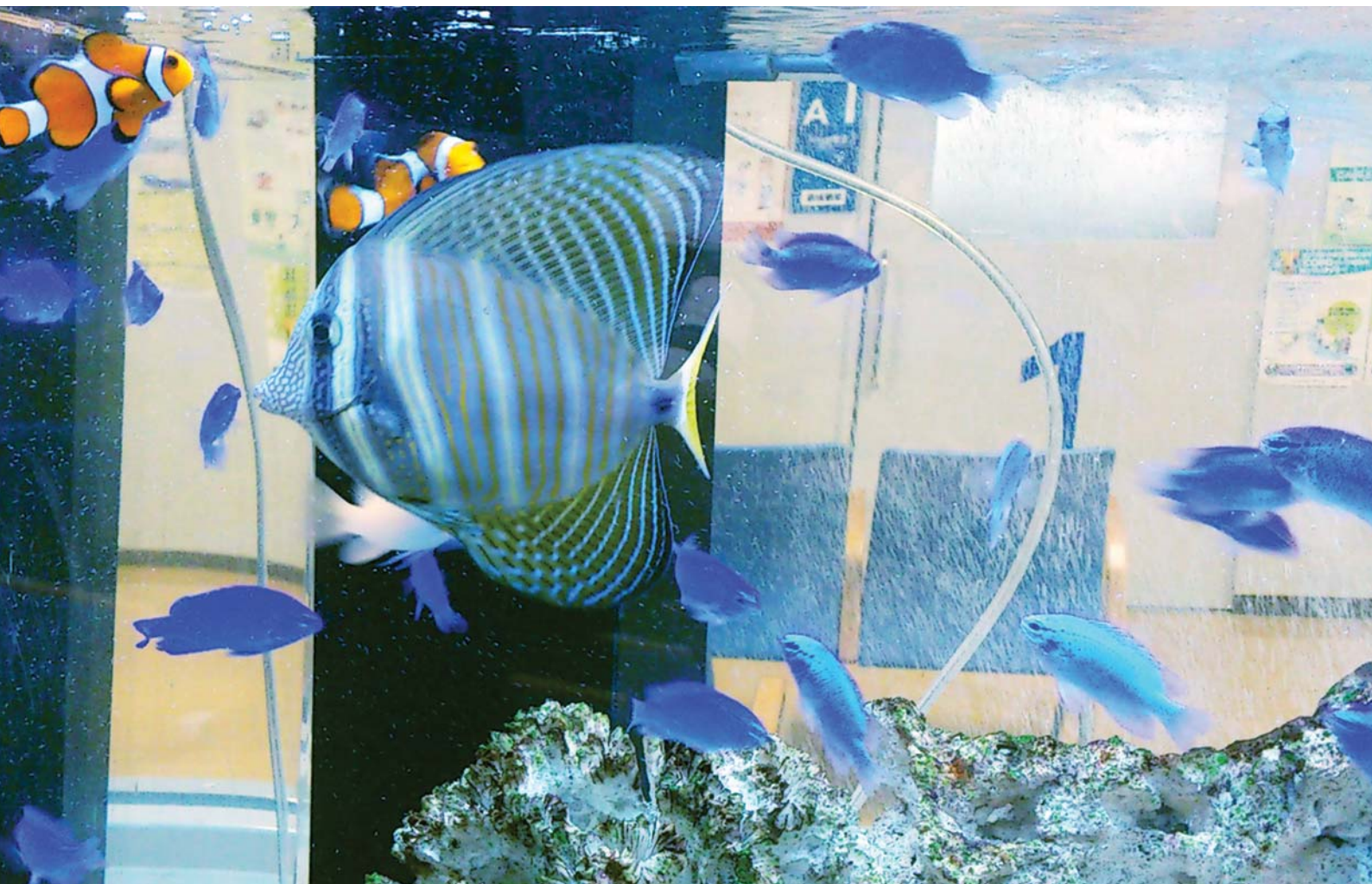
ロビーに設置された涼しげな水槽

NANBU TOKUSHUKAI HOSPITAL PUBLIC RELATIONS MAGAZINE 2012.8.10