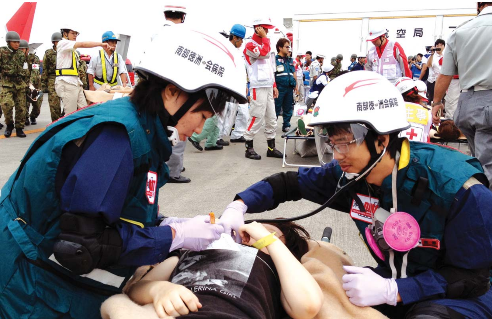
航空機事故対策総合訓練

NANBU TOKUSHUKAI HOSPITAL PUBLIC RELATIONS MAGAZINE 2012.10.10