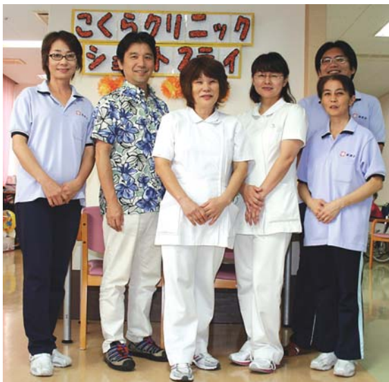
シフト中のスタッフに集まっていたいただきパチリ!

りしかも長時間にわたって下がらないのに対し、お肉を食べた後では血糖値がほとんど上がらず、しかも速やかに元の状態に戻ることが紹介されていました。もちろん、テレビ番組だけでは