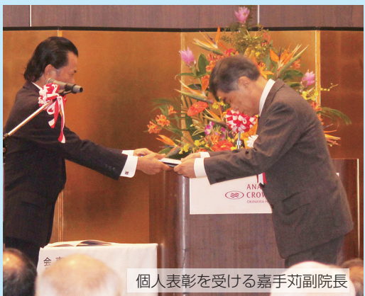
個人表彰を受ける嘉手苾副院長

南部地区医師会法人設立30周年 介護老人保健施設 東風の里 開設20周年 記念式典