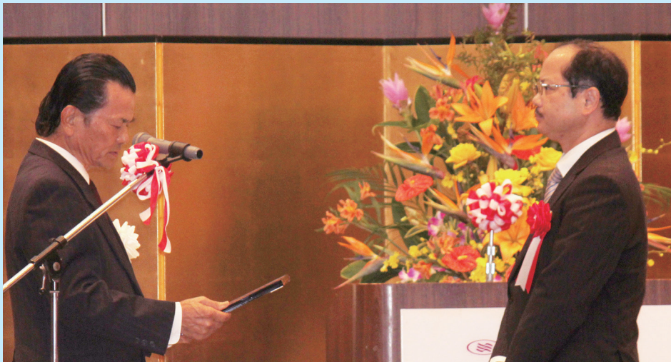
当院を代表して感謝状を受け取る赤崎院長