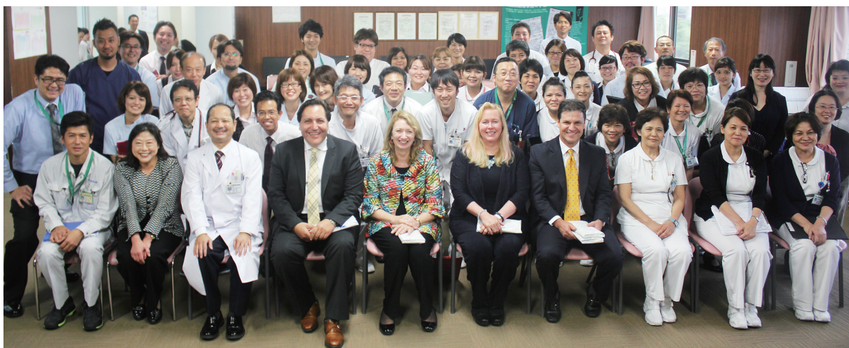
↑ 3人のサーベイヤー (審査員) を囲んで