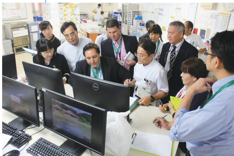
↑ 現場でのトレーサー