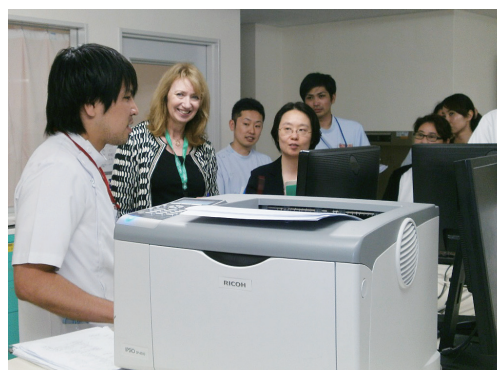
↑ 病棟 施設ツアー ← 栄養課 施設ツアー