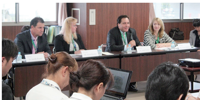
↑ オープニングカンファレンス