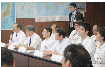
↑ オープニングカンファレンス

JCI 認証とは、アメリカのシカゴに本部がある国際医療機能評価機関（JCI）が医療機関に付与する世界標準の認証のことで、医療の質と患者様の安全、継続的な品質改善を重視しています。