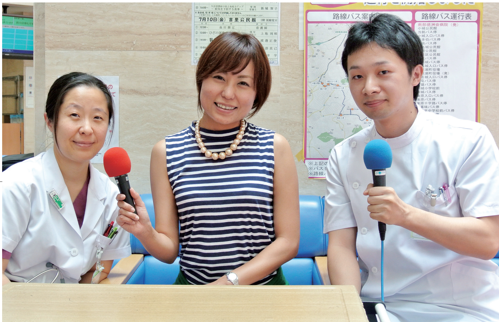
FM沖縄 ハッピーアイランドで紹介されました

NANBU TOKUSHUKAI HOSPITAL PUBLIC RELATIONS MAGAZINE