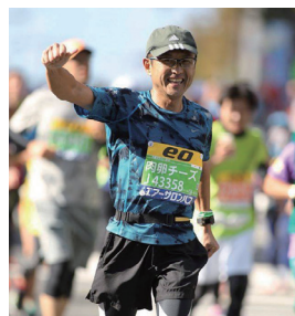
大阪マラソン（10月30日）にて

1961年、京都府生まれ。 2013年より南部徳洲会病院小児科部長として勤務。 日本小児科学会専門医・指導医 日本体育協会スポーツドクター 沖縄県小児保健協会食育部門委員 趣味はマラソンとテニスで、マラソンのベストは3時間58分