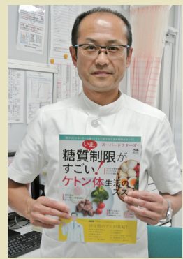
※お近くの書店やネット書店でお求めください