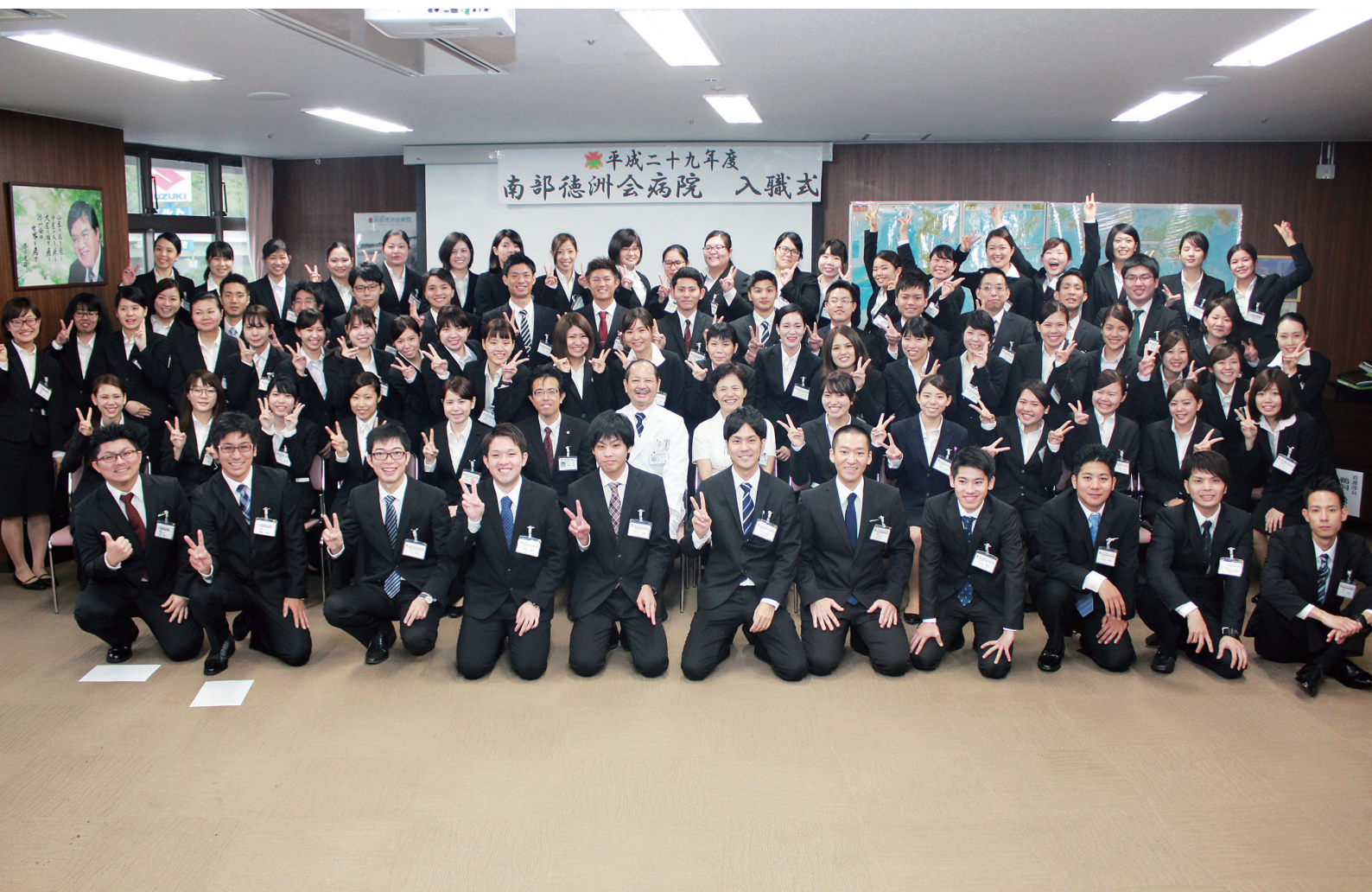
平成 29 年度入職式

NANBU TOKUSHUKAI HOSPITAL PUBLIC RELATIONS MAGAZINE