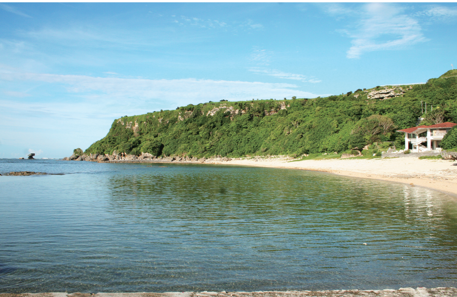
早朝の波名城の郷ビーチ

NANBU TOKUSHUKAI HOSPITAL PUBLIC RELATIONS MAGAZINE