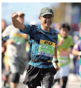
大阪マラソン (10 月 30 日) にて

1961 年、京都府生まれ。 2013 年より南部徳洲会病院小児科部長として勤務。 日本小児科学会専門医・指導医 日本体育協会スポーツドクター 沖縄県小児保健協会食育部門委員 趣味はマラソンとテニスで、マラソンのベストは 3 時間 58 分