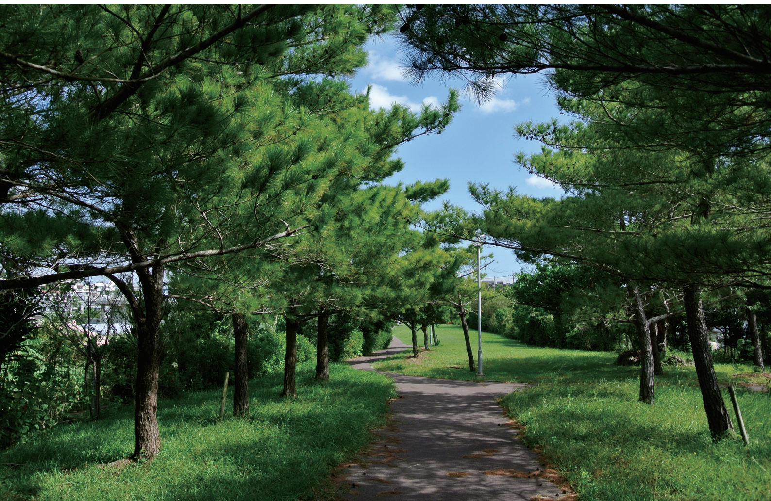
友寄馬場公園にて

NANBU TOKUSHUKAI HOSPITAL PUBLIC RELATIONS MAGAZINE