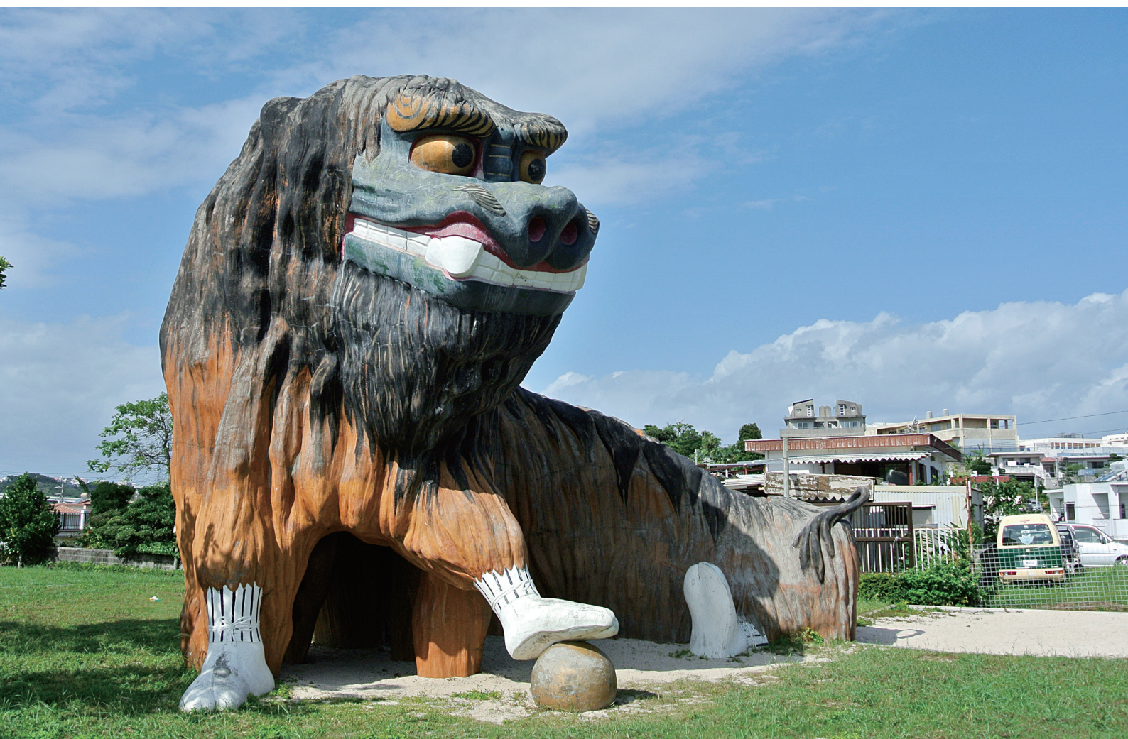
友寄馬場公園の獅子舞滑り台

NANBU TOKUSHUKAI HOSPITAL PUBLIC RELATIONS MAGAZINE