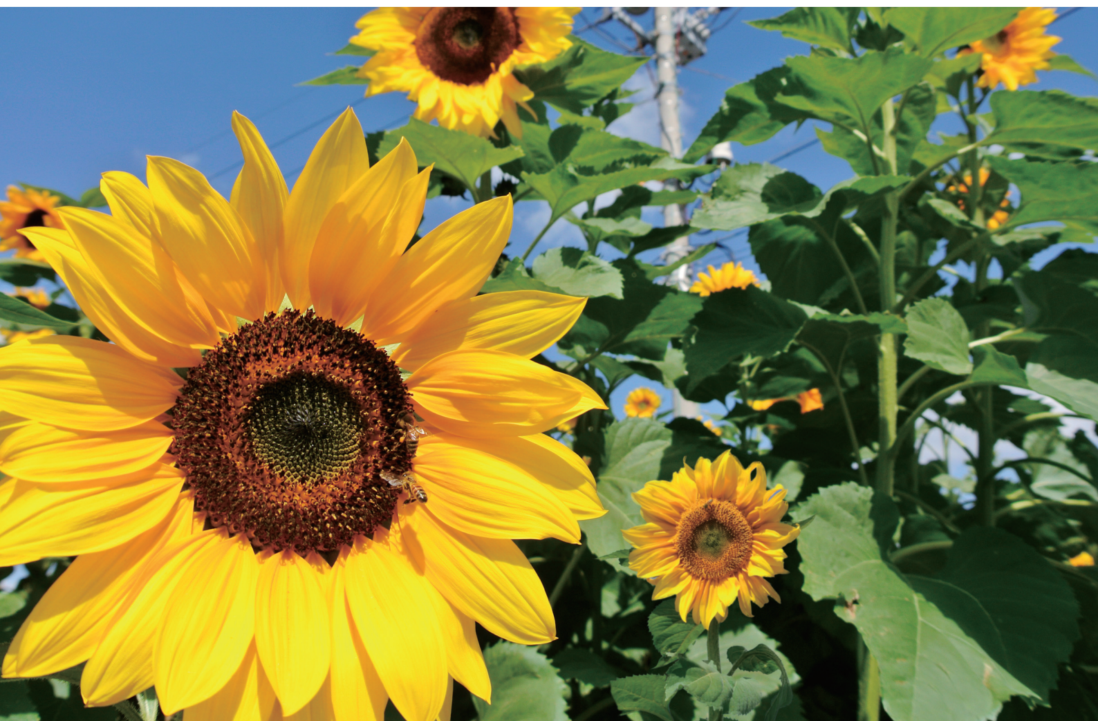
平和祈念公園のひまわり迷路

NANBU TOKUSHUKAI HOSPITAL PUBLIC RELATIONS MAGAZINE