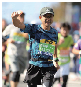
大阪マラソン (2016年10月) にて

1961年、京都府生まれ。 2013年より南部徳洲会病院小児科部長として勤務。 日本小児科学会専門医・指導医 日本体育協会スポーツドクター 沖縄県小児保健協会食育部門委員 趣味はマラソンとテニスで、マラソンのベストは3時間58分