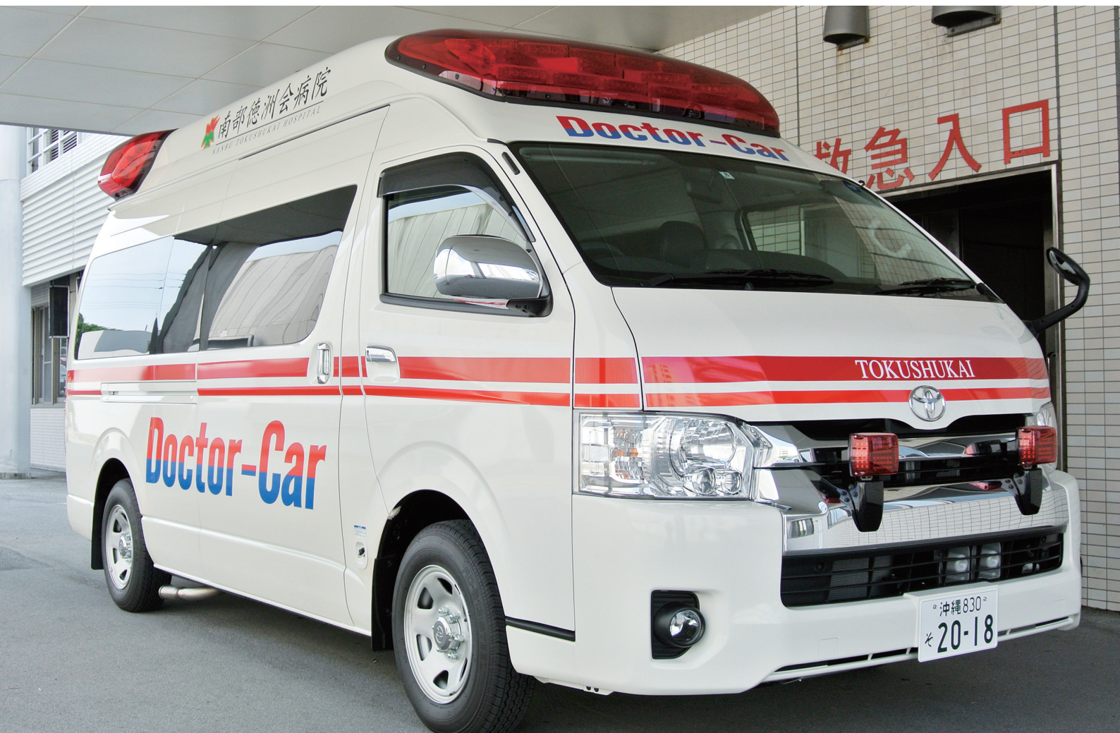
出動に備える新ドクターカー

NANBU TOKUSHUKAI HOSPITAL PUBLIC RELATIONS MAGAZINE