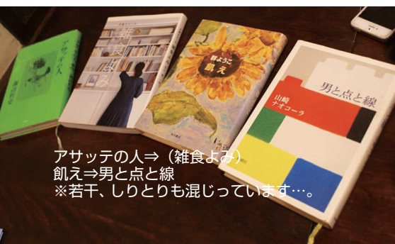
アサツテの人⇒(雑食よみ) 飢え⇒男と点と線 ※若干、しりとりも混じっています…。