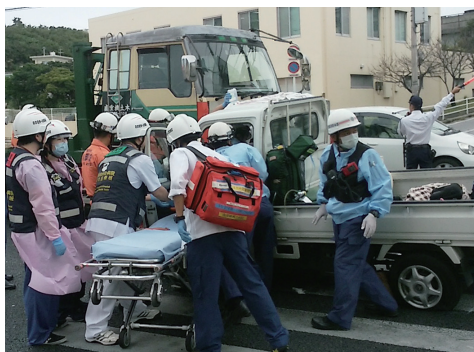
車両同士の衝突事故 救命と治療を実施