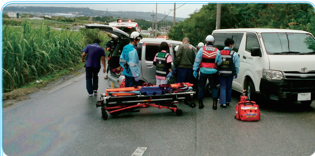
車両同士の衝突事故 診察と救出を並行して実施