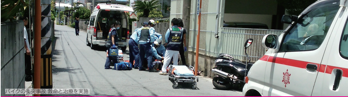
バイクの衝突事故 救命と治療を実施