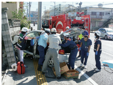
民家の塀に激突 診察と救出を並行して実施

くれない。とにかく、その時あるもので、ベストな医療処置を行い、命を救っていくしかない。まずは、現場に行く。そしてできることからやろう、と。心肺停止という情報で出動したものの、先着の消防隊から『会話している』