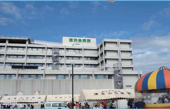
沖縄徳友会 百社会 のブース