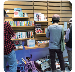
与那原駅舎展示資料館”で一日だけ開かれた『浮島書店』という本屋さんのこと。

ほんとうにいい天気、秋というよりもまだ夏だったこの日、駅舎の前庭には軽快な生演奏が響き、ご町内のパン屋さんのパンやスイーツ、そしてコーヒーのいい香りも漂っています。芝生で元気に遊ぶ子供たちをゆったり見守る大人たちがいて、なんだかいい感じ。さらに駅舎の中へと歩を進めると、そこには、いっぱいの本たちがいて、そして先ほどのシーンにつながる、というわけですね。