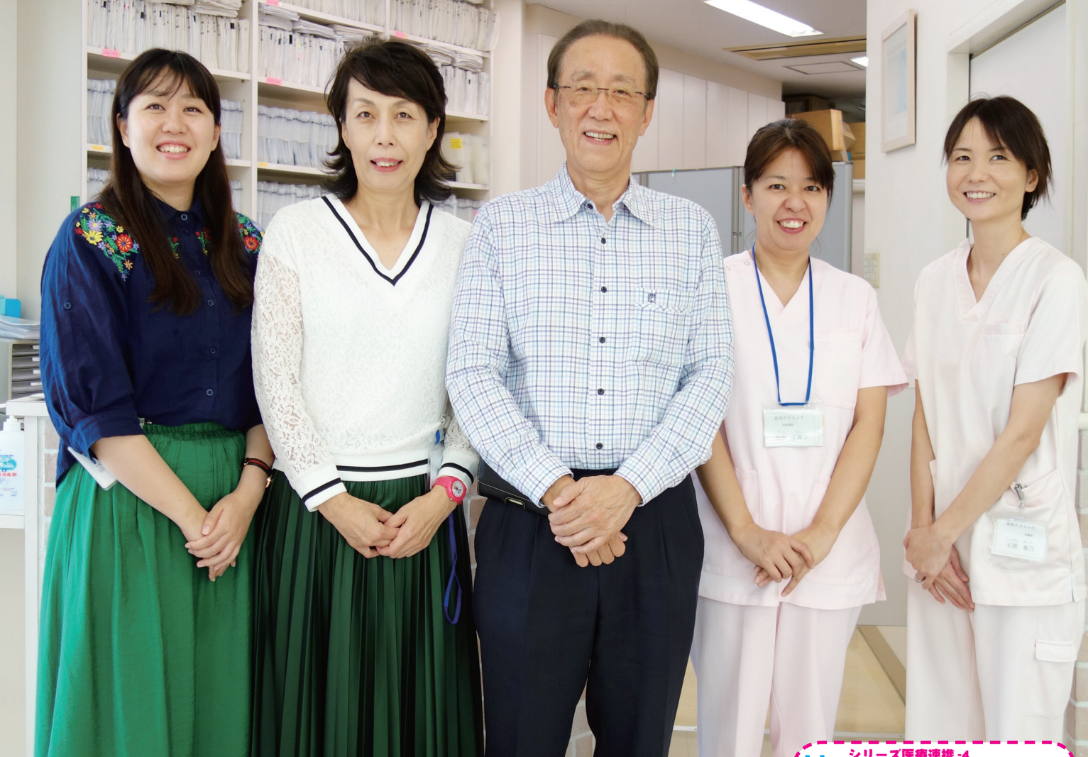
シリーズ医療連携-4 誰もが最善の医療を受けられる社会を目指して