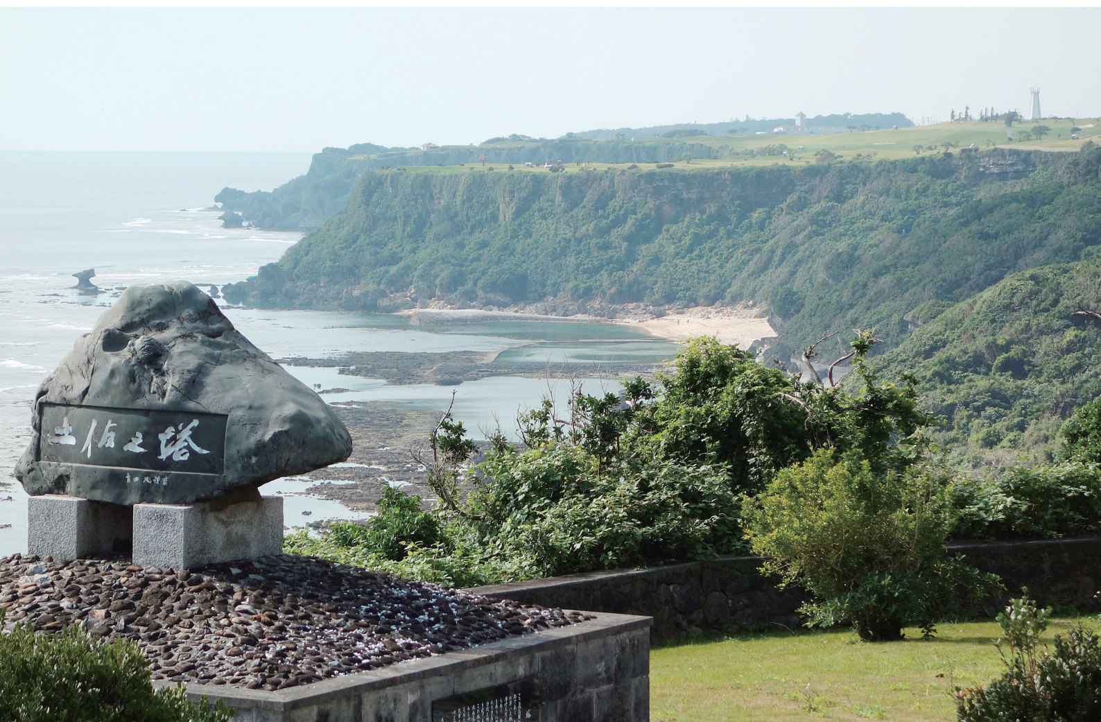
土佐の塔と春霞の慶座絶壁

NANBU TOKUSHUKAI HOSPITAL PUBLIC RELATIONS MAGAZINE