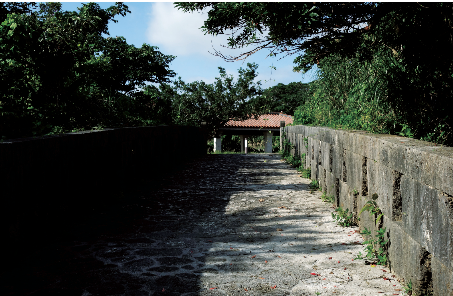
西部プラザ公園 当銘蔵グスクにて

NANBU TOKUSHUKAI HOSPITAL PUBLIC RELATIONS MAGAZINE