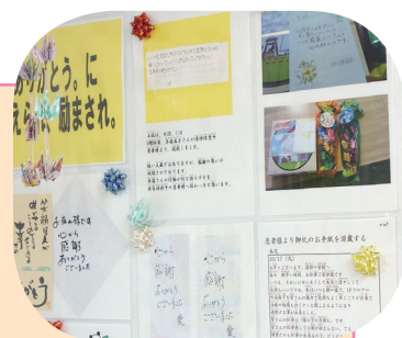
患者様やご家族から頂戴したお手紙の数々

合わせて『抜苦与楽』の姿勢で日々、献身的に治療、看護やリハビリテーションにあたられている医師をはじめとする医療スタッフの皆様の視点を共有することに努め、接遇の点でもマナーを形だけ守るのではなく、ひとりの人間として患者様やご家族の方にどう接するかを常に心がけており、時に患者様から頂く心のこもったお手紙が、私たちのこの上ない喜びとなっています。