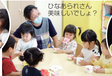
ひなあられさん 美味しいでしょ？