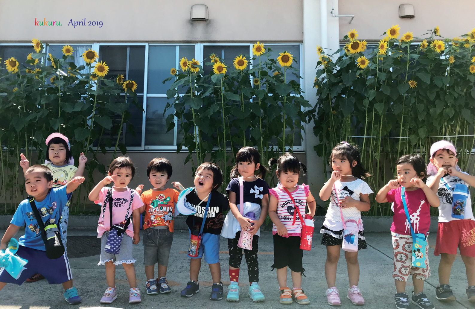
介護棟の花壇の前で撮影 ひまわりみたい元気な育て！