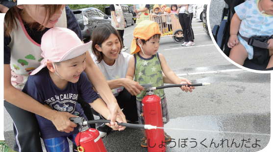
しょうぼうくんれんだよ