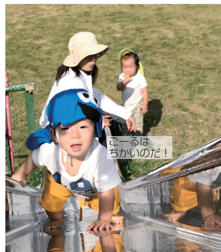
ごーるは ちかいのだ！