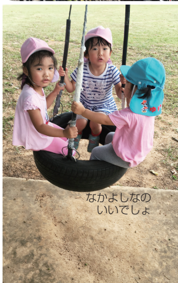
なかよしなの いいでしょ