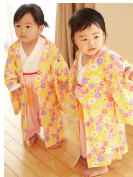
おきものなの おひめさまなのよ