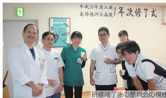
研修終了後の懇親会の模様

3月20日(水)、2018年度入職職員に対する1年次研修の最後の研修及び研修修了式が行われました。研修では年間を通して、JTAの客室教育訓練グループの皆さんを講師に迎え接遇マナーの強化を行っています。