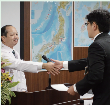
新入職員一人一人に辞令を手渡す赤崎院長