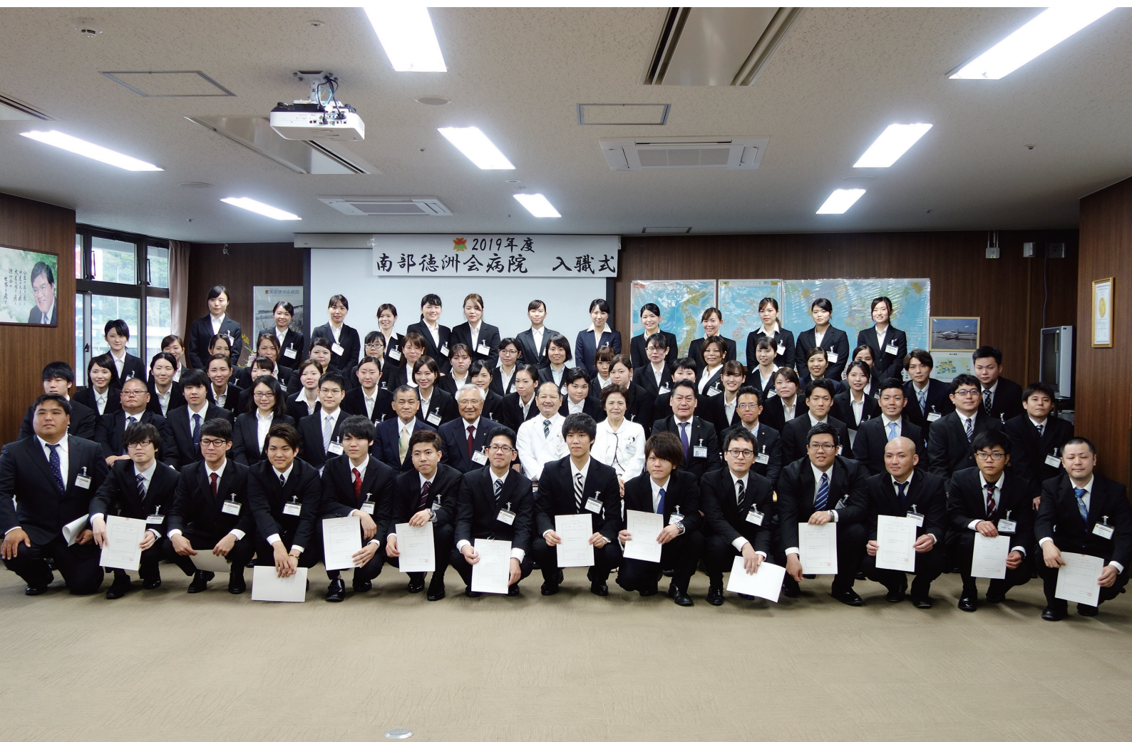
2019年4月1日 入職式にて

NANBU TOKUSHUKAI HOSPITAL PUBLIC RELATIONS MAGAZINE