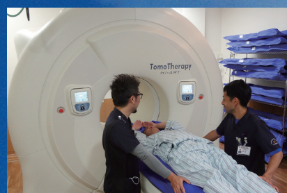
トモセラピーによる放射線治療開始（2012）