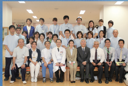
7階障害者病棟を回復期リハビリ病棟へ変更