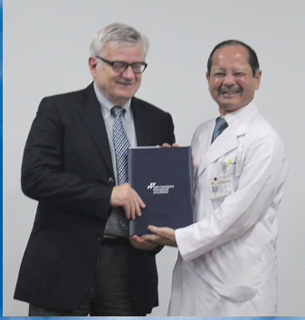
JCI 更新 (2018)