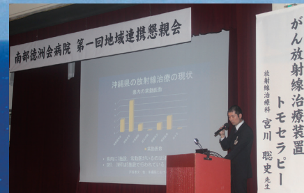
第1回 地域連携懇親会 (2016)