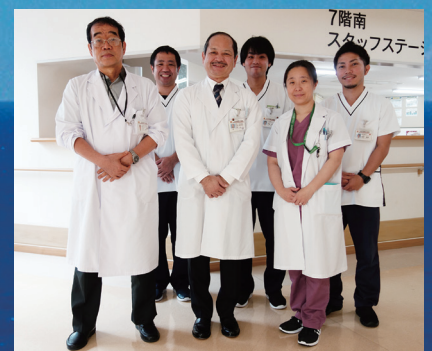
日本医療機能評価機構 副機能・付加機能認定 (2019)