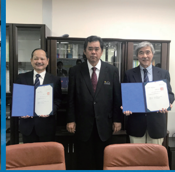
地域災害拠点病院認定 (2018)