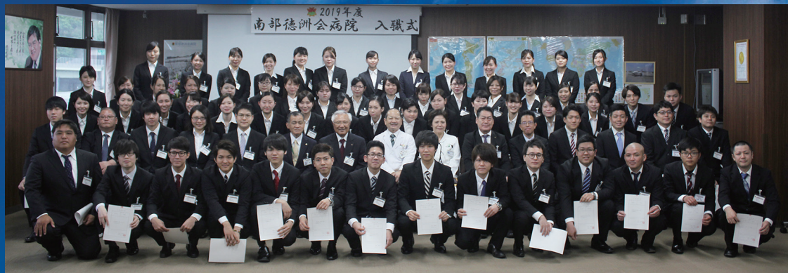
2019年 新入職員入職式

私たちは、いつでも、どこでも、だれでもが最善の医療を受けられる社会を目指し、日々、救急医療や僻地離島医療を柱に高度先進医療、介護福祉、予防医療に幅広取り組んでいます