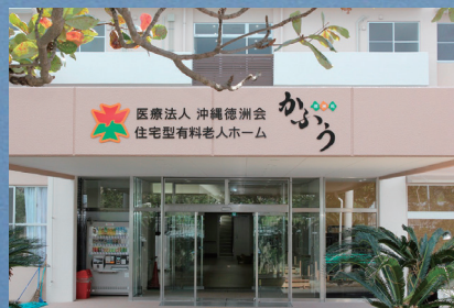
住宅型有料老人ホーム 徳洲苑かふう 開設