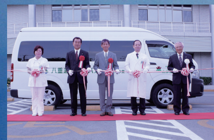
患者送迎バス運行開始 (2012)