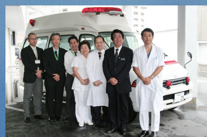
糸満市消防本部救急現場活動時における医師等の招聘に関する協定締結（2010）