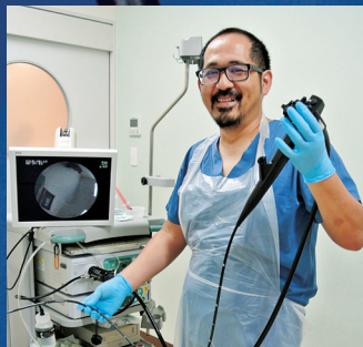
3階内視鏡室 運用開始 (2015)