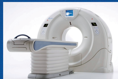
320列 Area Detector CT 稼働 (2012)