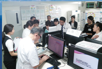
JMIP 認証審査 (2016)