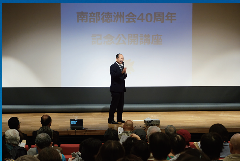
創立 40 周年記念 地域市民講座 (2019)

2019年 1月4日 日本医療機能評価機構 副機能・付加機能認定 4月28日 創立40周年記念地域市民講座 5月16〜17日 J M I P (外国人患者受入れ医療機関認証制度) 更新 6月1日 南部徳洲会病院創立40周年