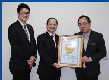
JCI (Joint commission international) 認証取得 (2015)