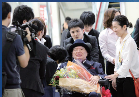
徳田虎雄理事長来沖 (2012)