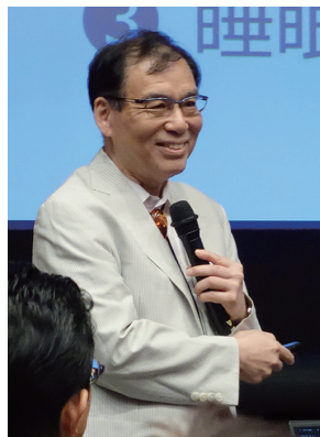
宮崎総一郎教授 『認知症を予防する眠り方』