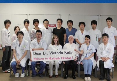
臨床研修病院群プロジェクト群星沖縄教育回診（2012）