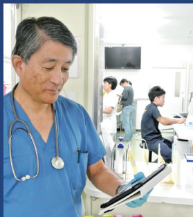
クラウド型モバイル心電図伝送システム運用開始 (2015)