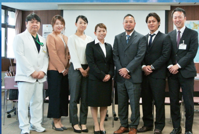
看護師の特定行為研修スタート (2018)