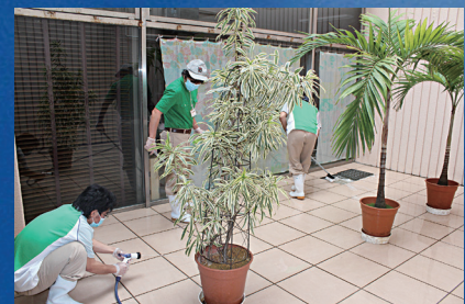
ワークプラザかふう開所 (2012)