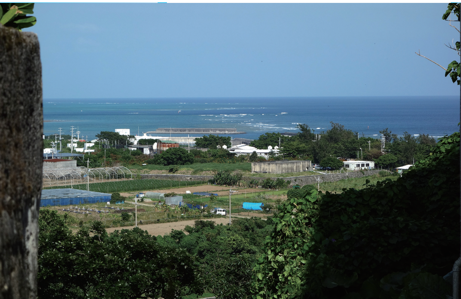
字具志頭の集落から海岸を望む

NANBU TOKUSHUKAI HOSPITAL PUBLIC RELATIONS MAGAZINE