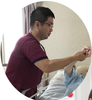
訪問リハビリの様様

営業時間：月～金 8:30～17:00、土 8:30～12:30 契約内容により 24 時間連絡、対応しています。 ☎ 098-835-7881