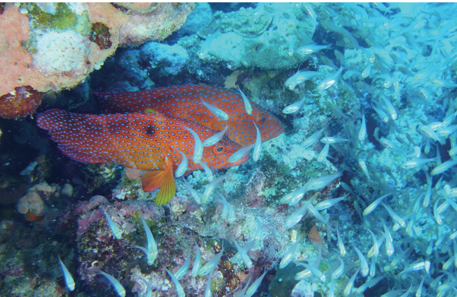
座間味にて撮影：清水徹郎 高気圧酸素治療部長

NANBU TOKUSHUKAI HOSPITAL PUBLIC RELATIONS MAGAZINE