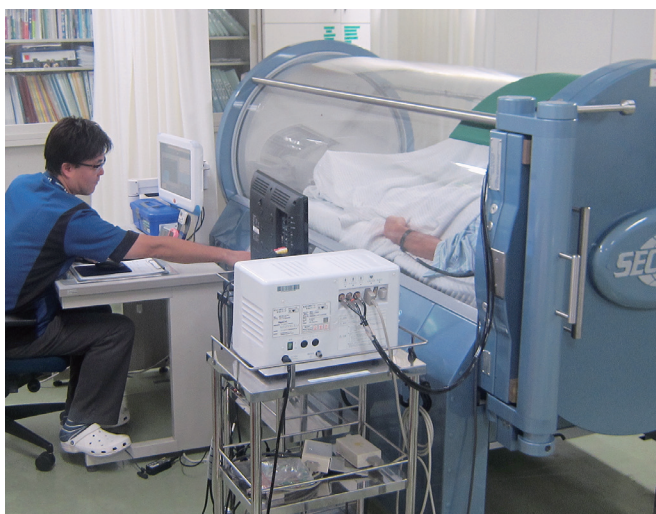
第1種装置 1人用の小型治療装置で、圧迫感を軽減するため、アクリル構造により装置外が見通せる構造になっています。