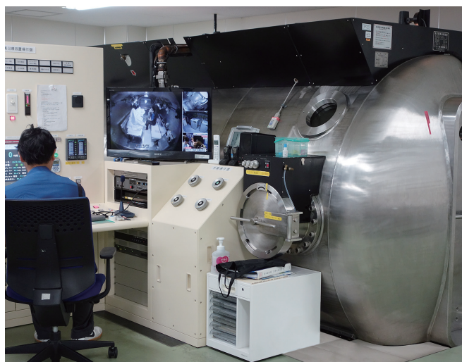
第2種装置 最大4人を収容。医師や看護師などの治療スタッフが一緒に入室できることから重症患者への治療にも活用されています。