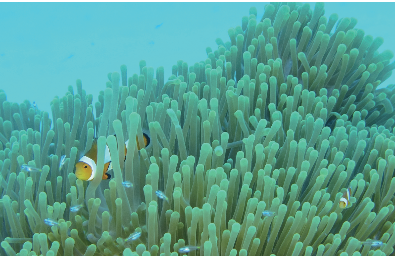
座間味にて撮影：清水徹郎 高気圧酸素治療部長

NANBU TOKUSHUKAI HOSPITAL PUBLIC RELATIONS MAGAZINE