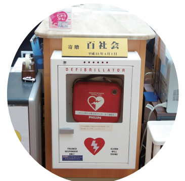
沖縄徳友会 百社会 様より寄贈していただいた AED 当院 1 階ロビーに設置

関係者を対象に BLS 講習を実施しています。今後は、一般の皆さん向けの講習開催を企画中です。ぜひ、お声掛けいただけると嬉しいです。