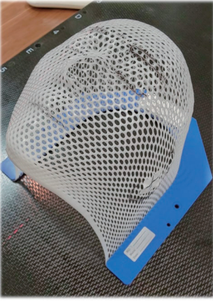
実際の頭部固定用シエル

前立腺がんに対する放射線治療は、医学や装置の進歩のため今や手術と効果は同じです。体調が変わらないので仕事や趣味も治療と両立できることが良い点ですが、問題は治療期間の長さでした。これまで当院の高性能機トモセラピーであっても1ヶ月半かかった治療が、サイバーナイフであれば1週間で終了します。ピンポイント性能の高さのおかげです。（ただし事前に1泊の入院で、前立腺内に位置の目印となる金マーカーと、前立腺と腸の間に副作用を減らすための吸収性ゲルを注射で挿入する処置を行います。）