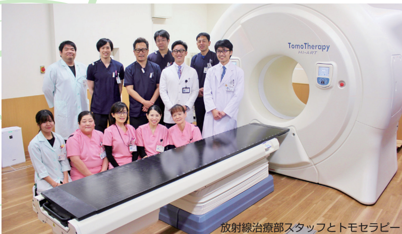
放射線治療部スタッフとトモセラピー

まず、どちらも身体の外からがんに対してエックス線のビームをあてて治療する装置である点は同じです。その上でサイバーナイフは、極細のビームでピンポイントくらいまでの小さな標的を狙い撃ちするのが得意です。トモセラピーは、逆に大きく複雑な形の標的も正確に照射できます。例えば、がんが脳へ転移した場合は放射線治療を行うことが多