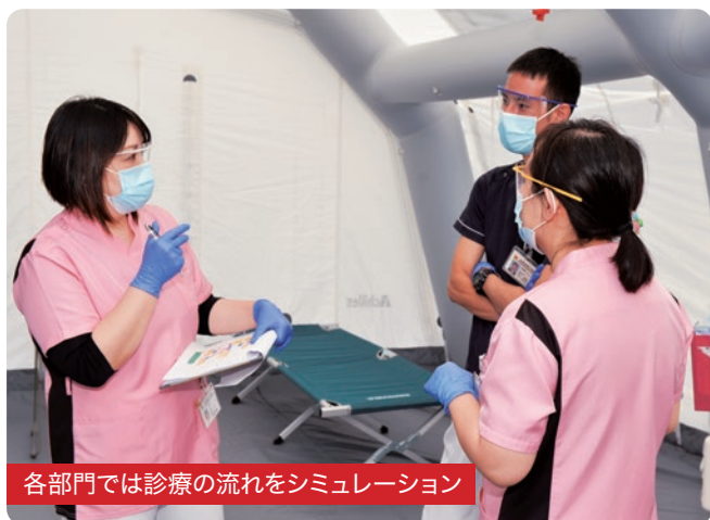
各部門では診療の流れをシミュレーション