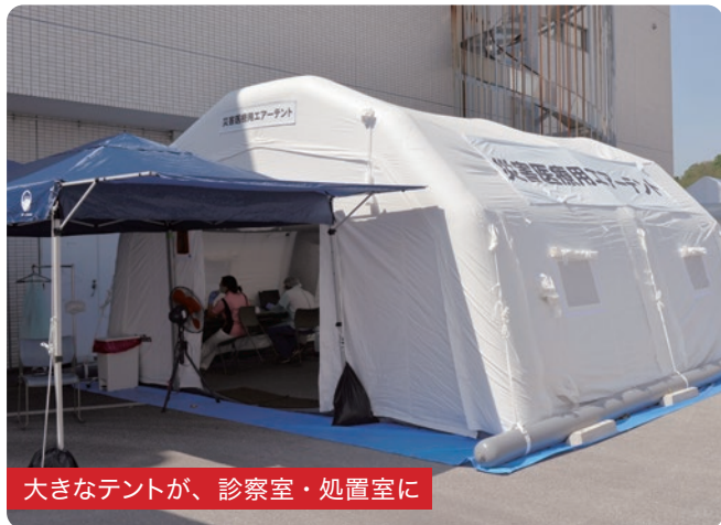
大きなテントが、診察室・処置室に

当院では、新型コロナウイルス感染症の拡大に伴う臨時措置として、発熱外来を設置し、屋外の専用テントにて診療を開始しました。