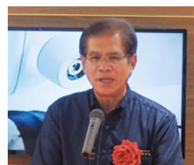
八重瀬町長 新垣 安弘