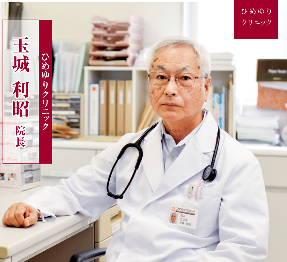
ひめゆりクリニック