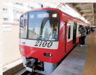
(図2) 神業スジ屋が活躍する京浜急行

実はスジ屋が最も活躍するのはダイヤが乱れたときなのです。人身事故、台風などの自然災害、沿線火災などでどこかの区間が不通となった場合に、どうやって通常のダイヤに戻していくのが本当の勝負です。各車両の性能、車両基地の空き状況、車両によっては地下鉄区間に進入できないなど様々な制約の中で臨時ダイヤを組まなければなりません。ダイヤをコンピューターに作らせている会社では、不通区間をコンピューターに入力すると自動で臨時ダイヤが出るそうなのですが、それをそのまま採用しても、処理が追いつかないのか全ての列車がノロノロ運転になることもあり(「スジが寝る」といいます)、なかなか回復しません。一方、羽田空港アクセスでおなじみの京浜急行(図2)では、いま現在でもスジ屋が定規でスジを引いており、いったんダイヤが乱ればその場で新しい線を沢山引いてダイヤ回復に努めています。通常は通過してしまう駅を臨時終着駅にして折り返したり、短い距離ながらわざと逆走させて反対方向の線路に移れる場所に移動した上で逆方向用に車両を移したり、通常コンピューター上では考えられないような、将棋でいうところの「一手」をやったのけます。そしてどこの会社よりも早く通常ダイヤに回復していくのです。この分野ではまだ人間の神業がコンピューターを上回っているということです。