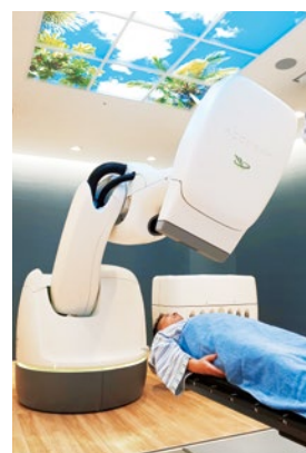
サイバーナイフ室にて治療の様子