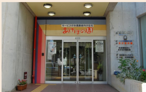
あけぼの園のエントランス

あけぼの園は、全35部屋バリアフ リーのサービス付き高齢者住宅。入居 条件は60歳以上の高齢者、あるいは要 介護認定を受けた60歳未満の方が対 象です。1階には支援員がおり、安否 確認を行う他、生活や健康面の相談も 受け付けています。住居の各部屋には ナースコールを配置し、24時間の見守 りサービスで安心。また、1、2、3階 のホールでは、がんじゅう体操・ヨガ・ フラダンス・音楽・三線など、一般の地 域の方が参加できる教室も開催。地域 の方との繋がりも大事にしています。