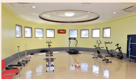
運動器具も充実しており、利用は自由です

あけぼの園は、全35部屋バリアフ リーのサービス付き高齢者住宅。入居 条件は60歳以上の高齢者、あるいは要 介護認定を受けた60歳未満の方が対 象です。1階には支援員がおり、安否 確認を行う他、生活や健康面の相談も 受け付けています。住居の各部屋には ナースコールを配置し、24時間の見守 りサービスで安心。また、1、2、3階 のホールでは、がんじゅう体操・ヨガ・ フラダンス・音楽・三線など、一般の地 域の方が参加できる教室も開催。地域 の方との繋がりも大事にしています。