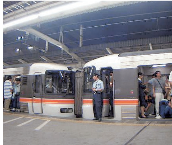
在りし日のムーンライトながら。席に座れずデッキで8時間立ちっぱなしの客も・・・