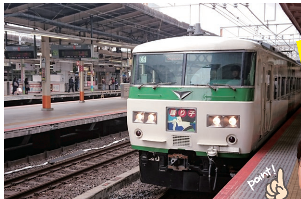
写真2 / 快速「ムーンライトながら」に用いられる185系電車。写真は特急「踊り子」運用時のもの

かつて栄華を誇ったブルートレインと呼ばれる寝台特急は、新幹線網の広がりと共に次々廃止となりました。そんな中で現代を生きる寝台特急として活躍を続けているのが「サンライズ瀬戸・出雲」で