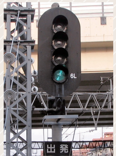
ホーム先端にある出発信号機

これは運転台の真後ろではじめて実際に見たとき驚いたのですが、甲子園でおなじみの阪神電車では黄信号のとき、ブレーキハンドルを握ったまま起立して、また座ります。おそらくですが「黄信号だからいつも以上に注意して運転するぞ」という意識を高めているのではと考えられます。阪神は駅間が短く、各駅停車の運転士は起立ばかりで大変だと思いますが、安全上とても良いことだと思います。ぜひ続けていただきたいです。これを実際に見てからは阪神電車の運転ゲームで黄信号を見たときにちゃんと起立している人がどこかにいるとか、いないとか(笑)。