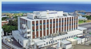
医療法人徳洲会 沖永良部徳洲会病院

2017年に新築移転した沖永良部徳洲会病院では、島の医療の拡充を図り、新たな医療機器の導入や職員の日々のスキルアップに努めています。